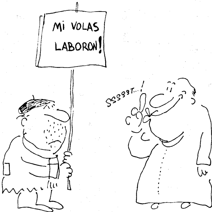
Kartuno de Jaime Perich, kontribuita de J. A. Vergara el Ĉilio.

Estu certa ke vi estas homo de Dio se vi portas ĝoje kaj silente la maljustecon.